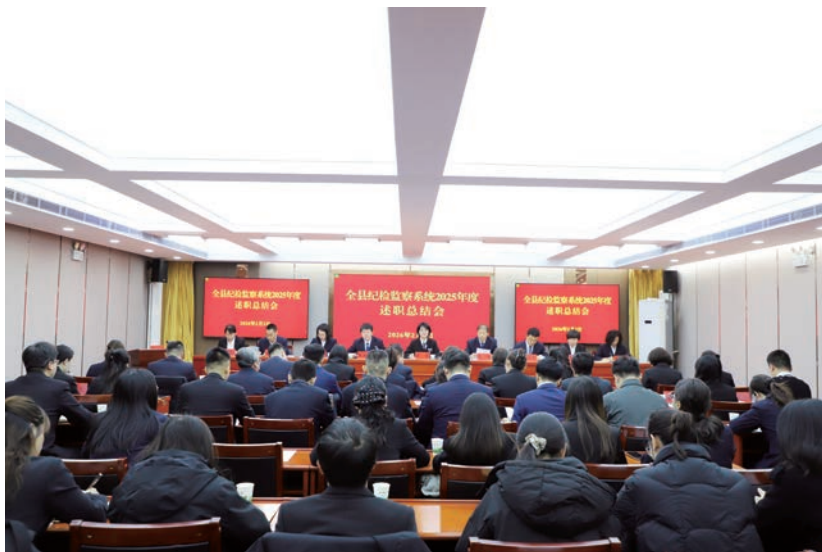
▲ 盐池县纪委监委召开全县纪检监察系统2025年度述职总结会，学习贯彻自治区纪委十三届五次全会精神。

经济社会发展紧密结合，以高质量纪检监察工作为“十五五”时期盐池经济社会发展保驾护航。