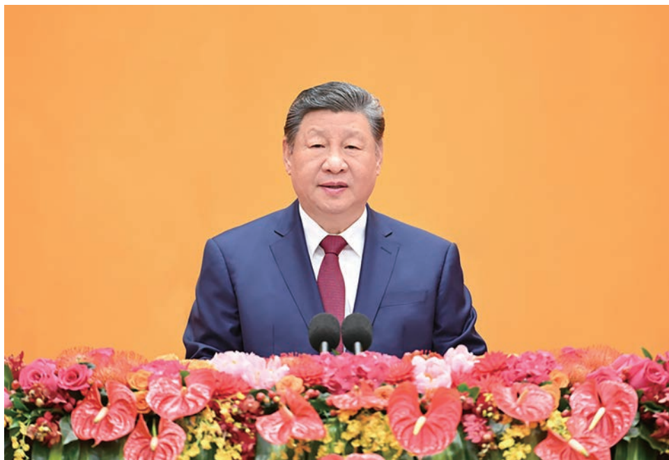
▲ 2月14日，中共中央、国务院在北京人民大会堂举行2026年春节团拜会。中共中央总书记、国家主席、中央军委主席习近平发表讲话。