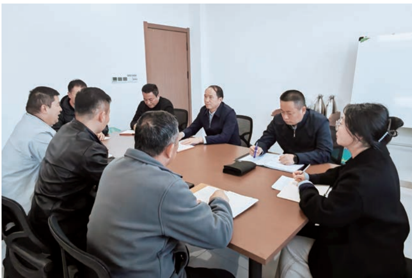
▲ 自治区纪委监委第八审查调查室党支部学习贯彻自治区纪委十三届五中全会精神。

“十五五”时期是基本实现社会主义现代化夯实基础、全面发力的关键时期，但国际形势错综复杂，国内改革发展稳定任务艰巨繁重。越是风高浪急、任重道远，越需要保持党的肌体健康、先进纯洁，确保党始终成为中国特色社会主义事业的坚强领导核心。作为纪检监察机关审查调查部门，要深刻认识反腐败斗争的严峻性复杂性长期性艰巨性，自觉以历史眼光、从战略高度深刻认识反腐败斗争的重大战略意义，深刻领悟新时代反腐败斗争的使命任务，清醒把握当前反腐败斗争“两个仍然”的科学判断，坚定打赢反腐败斗争的必胜信心、如磐恒心、坚强决心，保持高压态势不动摇，有腐必反、有贪必肃、