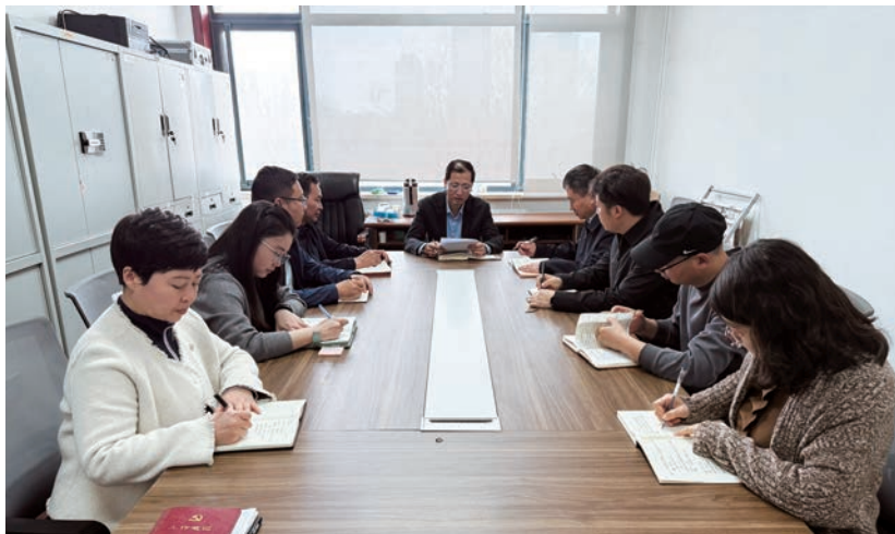
▲ 自治区纪委监委第三监督检查室学习贯彻自治区纪委十三届五次全会精神。